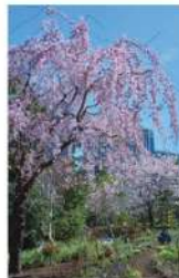
リニューアル作業の様子

四季を通じて日々変化する自然の美しさを楽しむスタイルのガーデン。植物が風にそよぎ、太陽の下、また雨や雪の中で佇む姿など様々な様子が感じられます。都心部のエコロジカルネットワーク拠点の一つとして、生物多様性に寄与し、地域やお勤めの皆さまと持続可能な空間づくりを目指します。